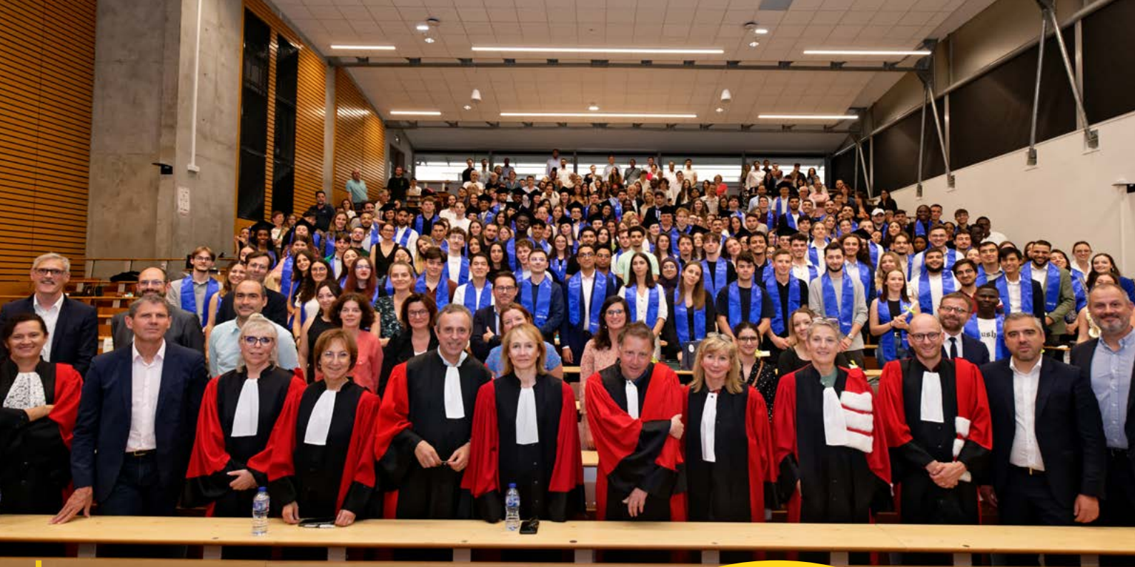
Remise de diplômes du CLEA @iaelyon, 2024