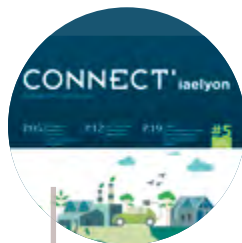
Magazine des partenaires de l'iaelyon