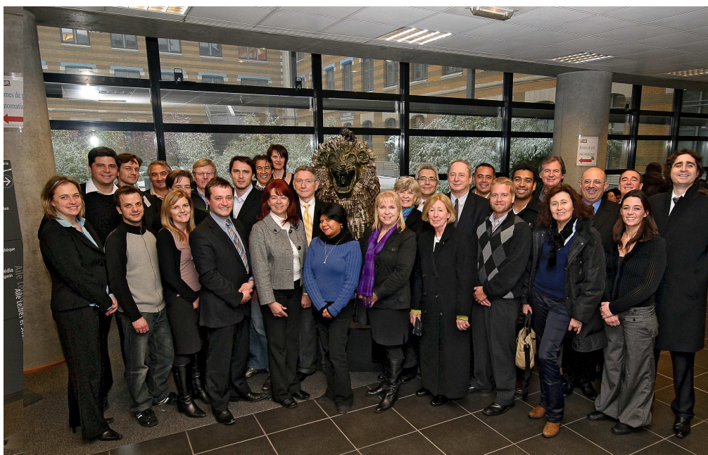
Un groupe d'intervenants de l'International Week 2010

Les séminaires sont organisés du 6 au 8 janvier puis du 10 au 12 janvier 2011.